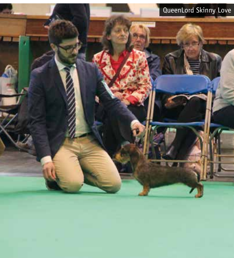
QueenLord Skinny Love