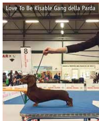
Love To Be Kisable Gang della Parda