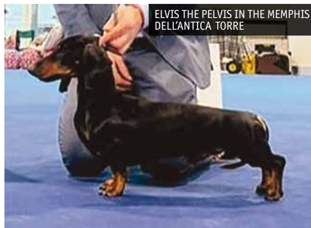
ELVIS THE PELVIS IN THE MEMPHIS DELL'ANTICA TORRE