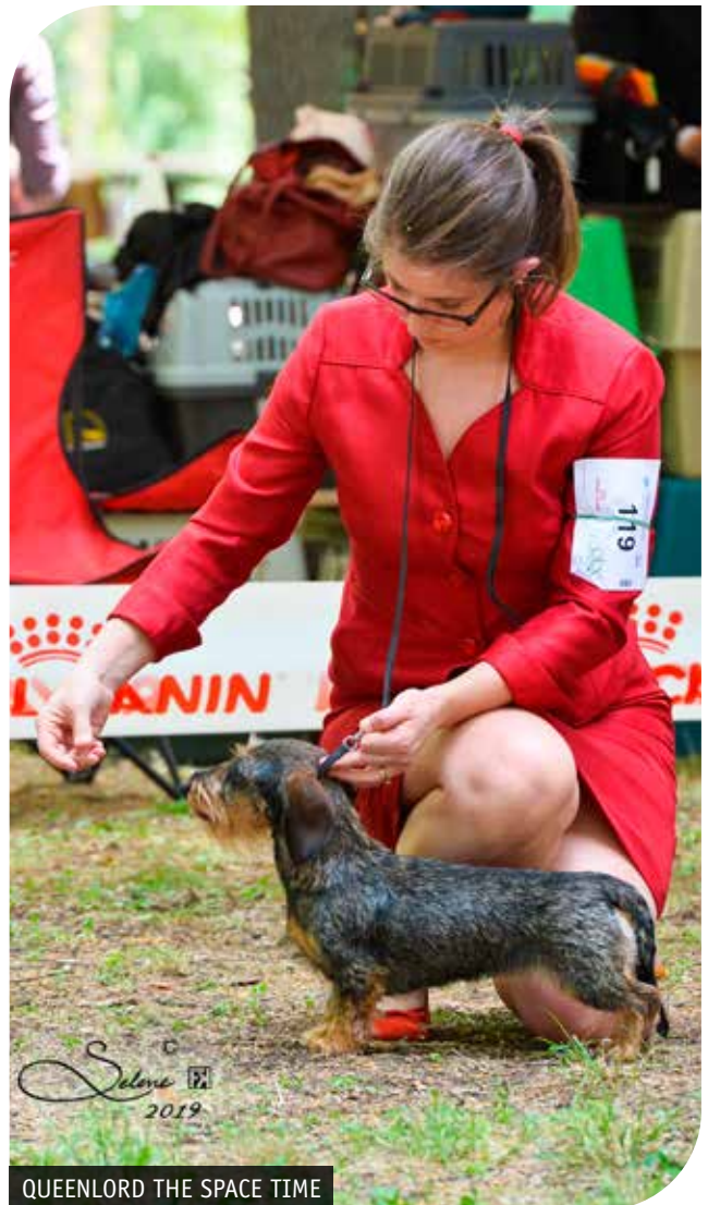
QUEENLORD THE SPACE TIME