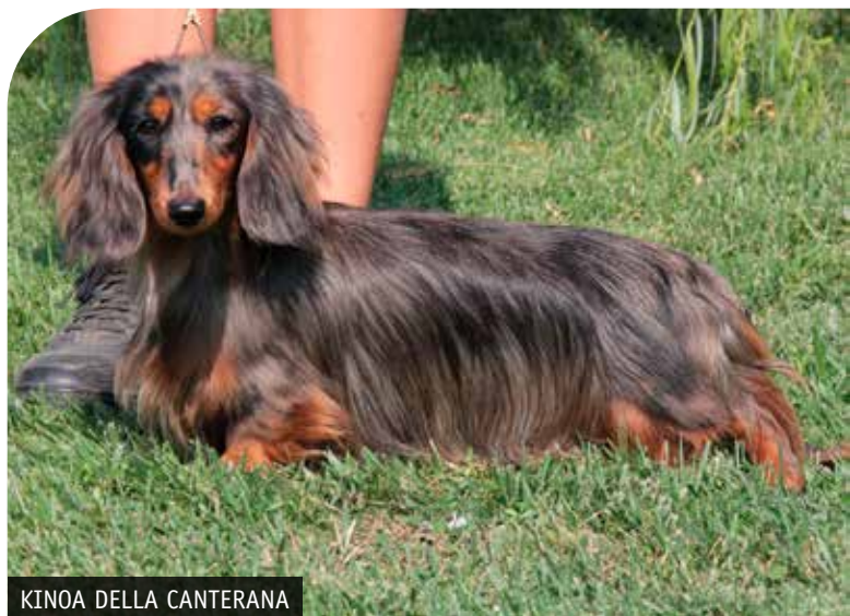
KINOA DELLA CANTERANA