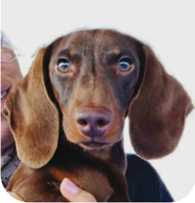
MY WAY DELLA ROCCA DEI PAPI