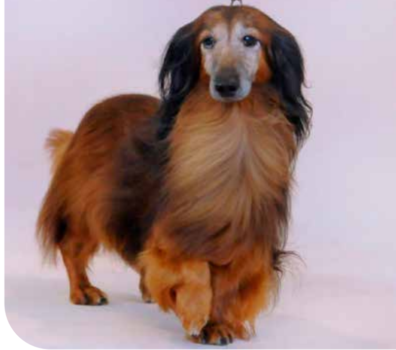
MALNÂT DELLA CANTERANA