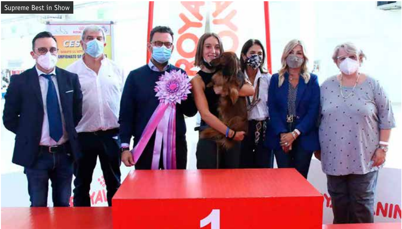
Supreme Best in Show