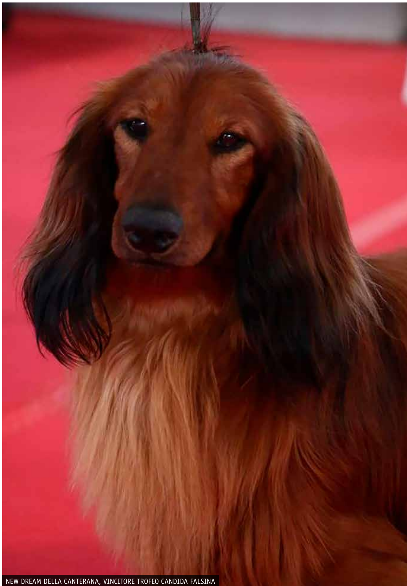
NEW DREAM DELLA CANTERANA, VINCITORE TROFEO CANDIDA FALSINA