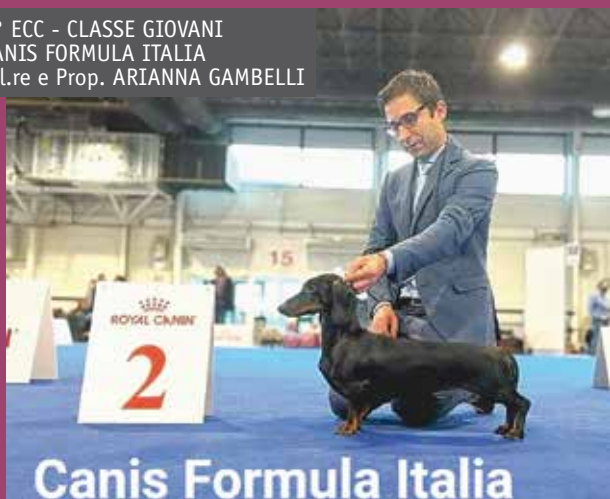
Canis Formula Italia