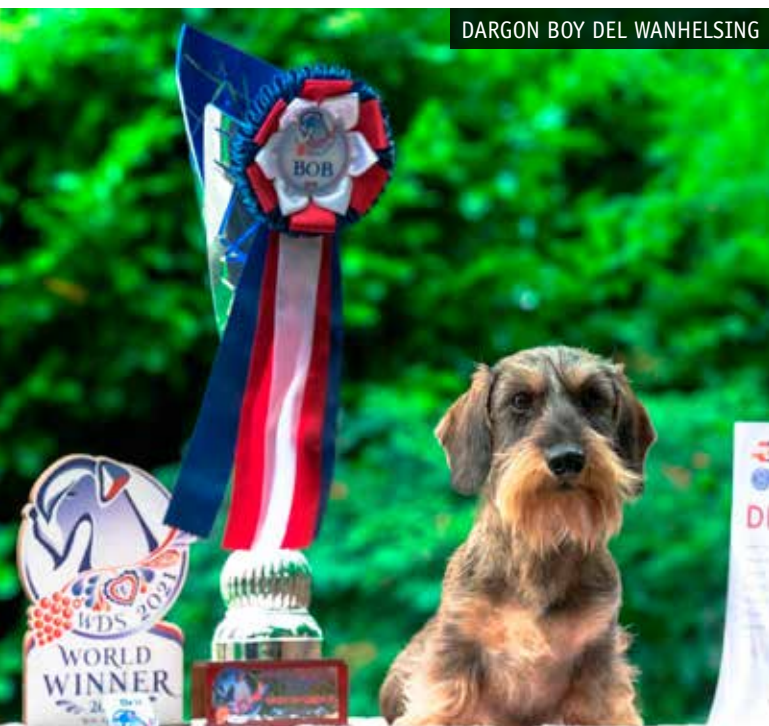
DARGON BOY DEL WANHELISING