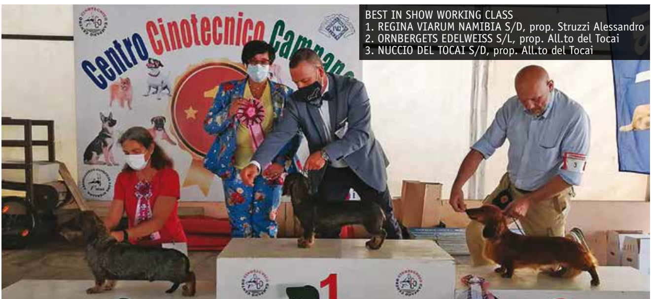
BEST IN SHOW WORKING CLASS 1. REGINA VIARUM NAMIBIA S/D, prop. Struzzi Alessandro 2. ORNBERGETS EDELWEISS S/L, prop. All.to del Tocai 3. NUCCIO DEL TOCAI S/D, prop. All.to del Tocai