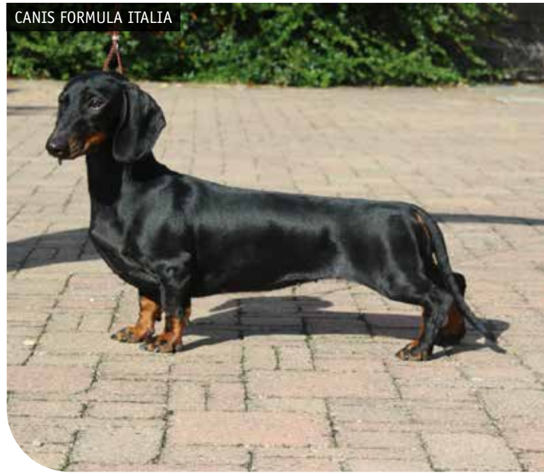
CANIS FORMULA ITALIA