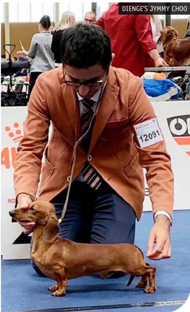
DIENGE'S JYMMY CHOO