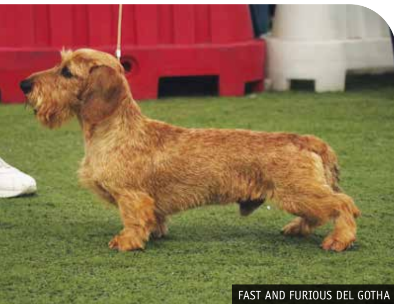
FAST AND FURIOUS DEL GOTHA