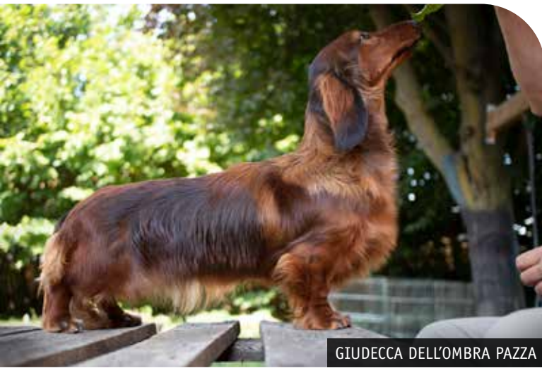
GIUDECCA DELL'OMBRA PAZZA