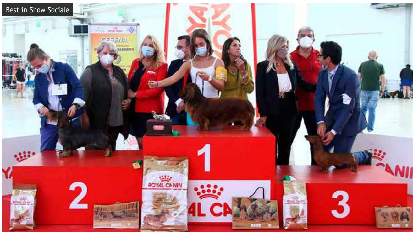
Best in Show Sociale