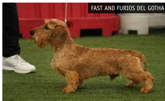
FAST AND FURIOS DEL GOTHA