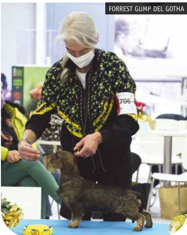
FORREST GUMP DEL GOTHA