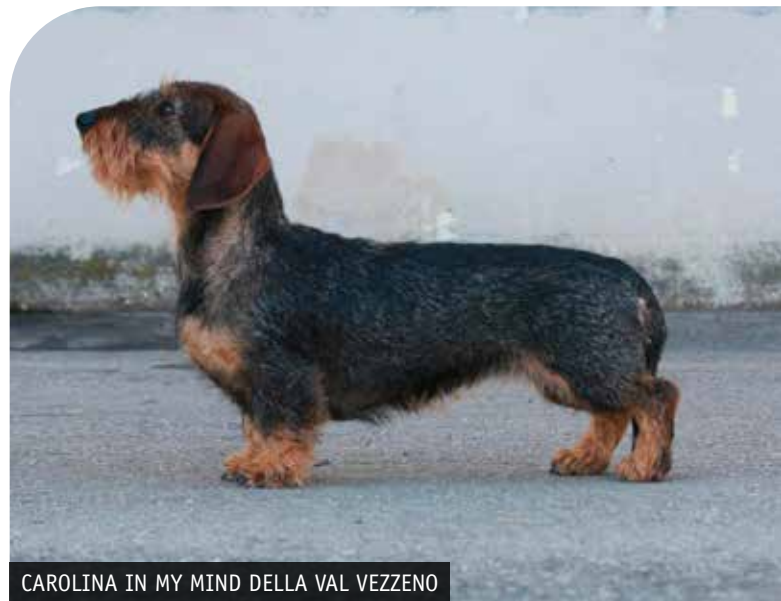
CAROLINA IN MY MIND DELLA VAL VEZZENO